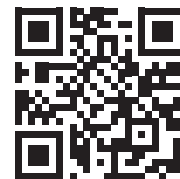
申し込み用QRコード

参加受付メールを印刷して、会場の受付に持参してください。(スムーズに受付できます)